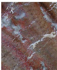
Figure 1. Marie Vanesse, Cerfontaine imité, https://atelier-pigments.blogspot.com , avec l'aimable autorisation de l'artiste © Marie Vanesse